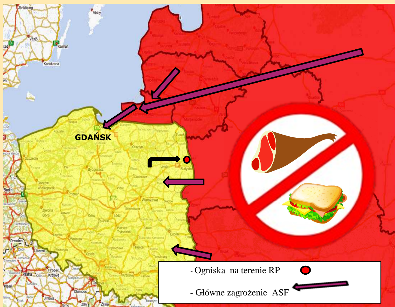
Schemat nr 1.

AFRYKAŃSKI POMÓR ŚWIŃ (ASF) w szybkim tempie dotarł do naszych granic, występuje w państwach graniczących od wschodu z Polską, a także na terenie naszego kraju. Stwierdzono występowanie tej choroby, nie tylko u dzików, ale także u trzody chlewnej. Dodatkowo służby sanitarne Federacji Rosyjskiej podały informacje o stwierdzeniu wirusa w środkach spożywczych pochodzących od świń, wyprodukowanych przez jednego z największych producentów mięsnych działających na terenie Rosji.